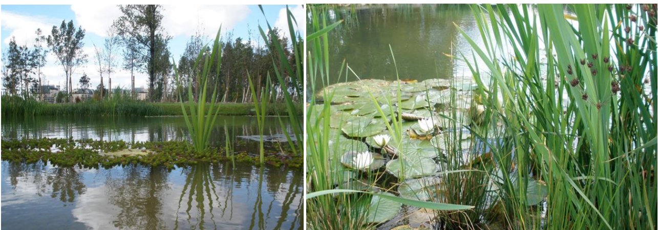
La Ville a augmenté de 30% la surface des ses espaces verts grâce à la création du nouveau Parc des Impressionnistes.