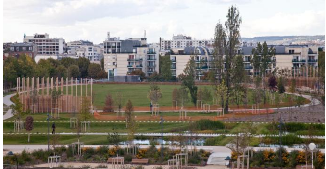
Vue du Parc des Impressionnistes depuis les futurs logements