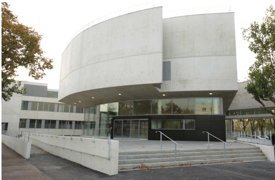
Façade sur entrée

S'inscrivant dans le cadre du Contrat de Plan État - Région 2000-2006, le projet est destiné à rééquilibrer l'offre universitaire au nord des Hauts-de-Seine. Ce pôle universitaire à dominante tertiaire est implanté dans le Parc Technologique des Barbanniers, sur un terrain de 2,5 hectares. Ce projet ambitieux Haute Qualité Environnementale qui associe architecture contemporaine et intégration paysagère, été inauguré par Patrick Devedjian Ministre de la relance-Président du Conseil général des Hauts-de-Seine et Valérie Pécresse Ministre de l'enseignement supérieur en octobre 2008.